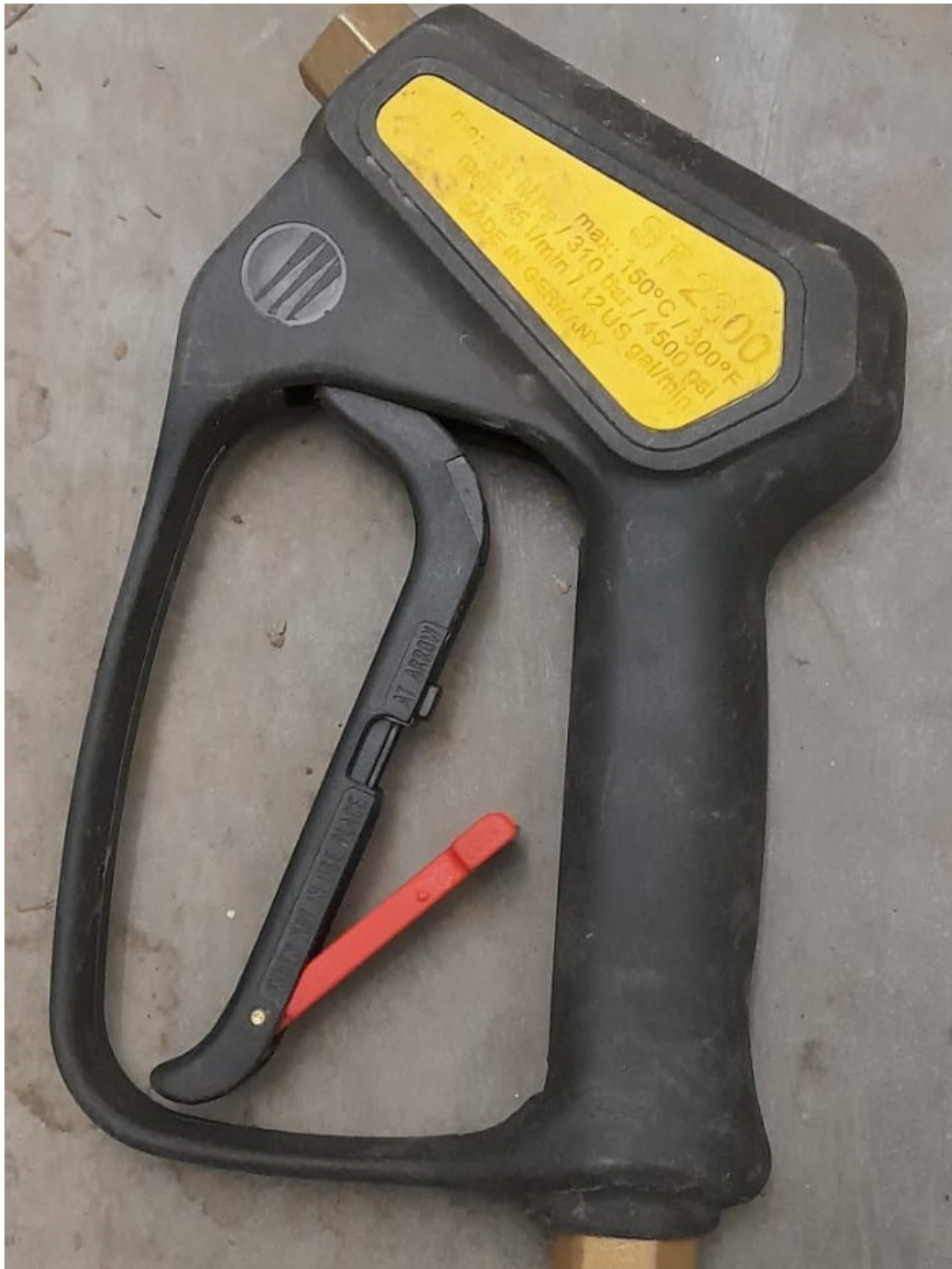
Afbeelding: klipje op bedieningshendel