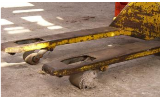
draad tussen de wielen