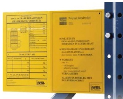
Afbeelding: Belastingsplaat magazijnstellingen