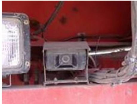
Foto: Camera achter op kipper