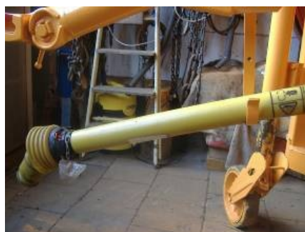
Foto: Houd de koppeling van de aftakas schoon