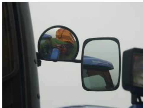
Foto: Deze spiegels zorgen voor goed zicht

Trekkers worden in combinatie met werktuigen ingezet voor verschillende werkzaamheden. Werkzaamheden in een moderne trekker met veiligheidscabine zijn veilig. Risico's ontstaan bij: het aankoppelen van werktuigen, werken op hellingen en deelname aan het verkeer.