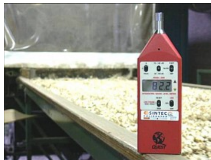
Geluidmeting (resultaat 82,2 dB(A))

Bij veel werkzaamheden wordt de norm voor schadelijk geluid, (80 dB(A)) overschreden. Afhankelijk van het aantal decibels, de toonhoogte en de blootstellingsduur kan daardoor blijvende gehoorschade optreden, tenzij er gehoorbescherming gedragen wordt. Enkele voorbeelden van bijkomende risico's zijn stress, vermoeidheid, verminderde concentratie, niet meer waarnemen van signalen en stijging van bloeddruk en hartslag. Lawaai verhoogt ook de kans op ongevallen.