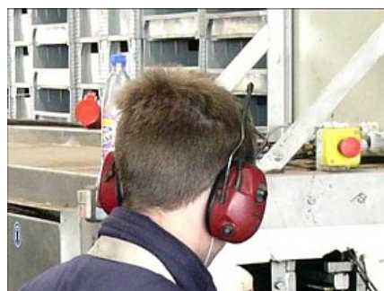
Oorkappen met ingebouwde radio