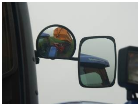
Foto: Deze spiegels zorgen voor goed zicht

Trekkers worden in combinatie met werktuigen ingezet voor verschillende werkzaamheden. Werkzaamheden in een moderne trekker met veiligheidscabine zijn veilig. Risico's ontstaan bij: het aankoppelen van werktuigen, werken op hellingen en deelname aan het verkeer.