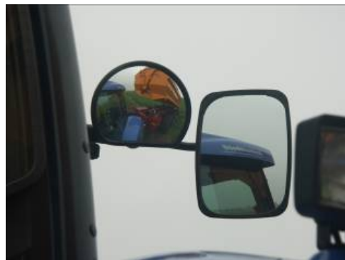
Foto: Deze spiegels zorgen voor goed zicht

Trekkers worden in combinatie met werktuigen ingezet voor verschillende werkzaamheden. Werkzaamheden in een moderne trekker met veiligheidscabine zijn veilig. Risico's ontstaan bij: het aankoppelen van werktuigen, werken op hellingen en deelname aan het verkeer.