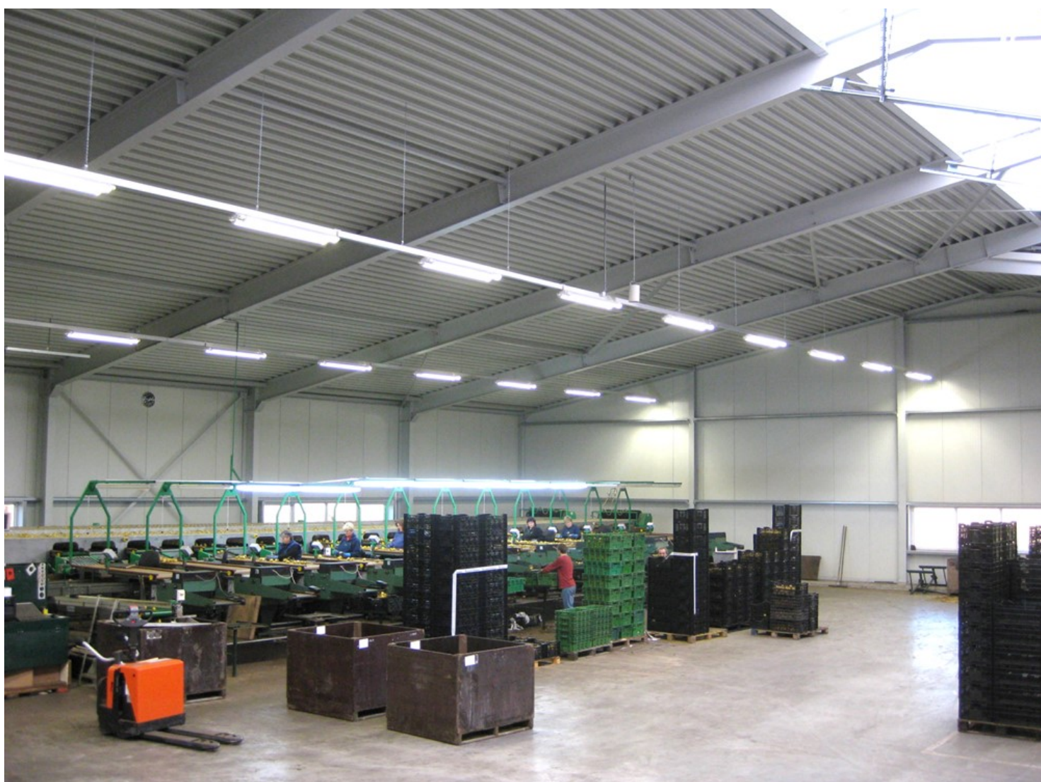
Afbeelding: Voorbeeld van zowel goed daglicht als kunstlicht op het werk