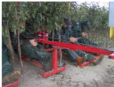
Foto's: Advies bij langdurig kruipen of knielen: mechaniseer of gebruik zit(hulp)middelen om knielen te voorkomen, bijv. gewasstoeltje of portaaltrekker met zitjes

Bij werkhoudingen wordt onderscheid gemaakt in dynamische en statische houdingen. Er is sprake van een statische werkhouding als een lichaamsdeel 4 seconden of langer eenzelfde houding aanneemt. Het langdurig (statisch) aannemen van een verkeerde houding is doorgaans risicovoller dan bij dynamische werk, waarbij het lichaam zich tussentijds kan herstellen.