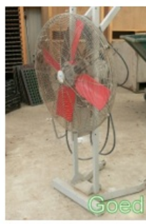
Goed afgeschermd ventilator