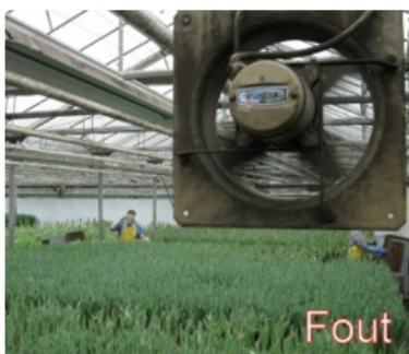
Onafgeschermd ventilator, laag geplaatst

Zie onderstaande foto's voor afscherming van de ventilator.