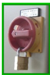
Afbeelding: vergrendelde hoofdschakelaar

Zie onderstaand voorbeeld van een vergrendelde hoofdschakelaar