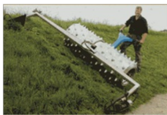
Foto: Tweewielige trekker met speciale noppen voor taluds

Overzicht van ingeschatte scores m.b.t. veiligheid, fysieke belasting en werksnelheid bij drie maaitechnieken op taluds