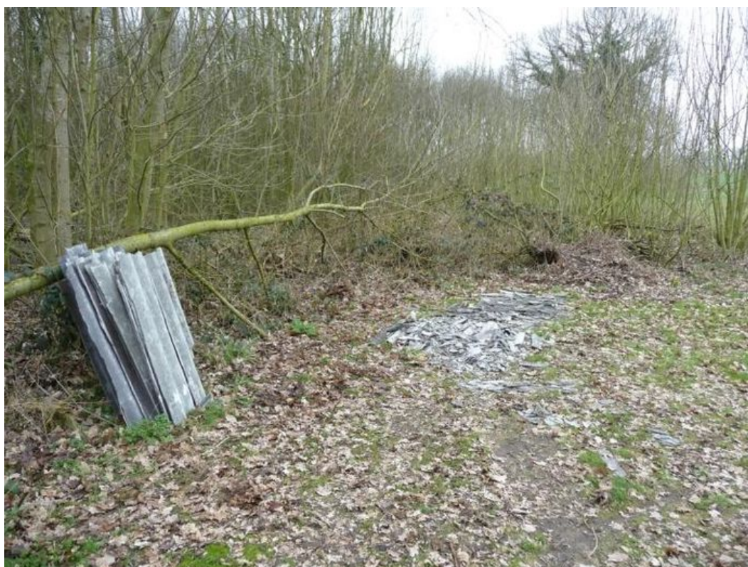
Afbeelding: Asbest in de natuur