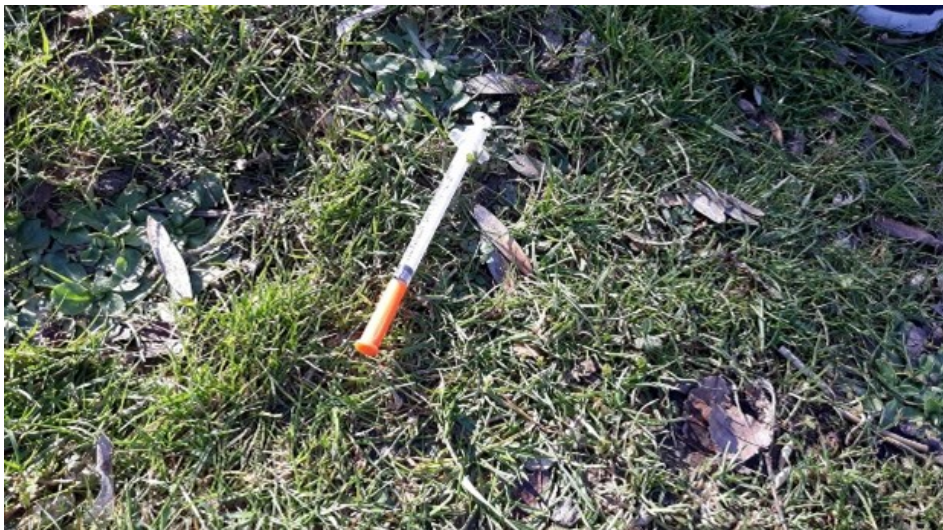
Afbeelding: Injectienaald in de natuur