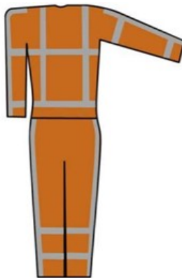
Afbeelding: volledige uitrusting signaalkleding klasse 3