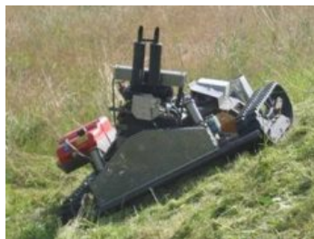
Foto: Op afstand bestuurbare maaier