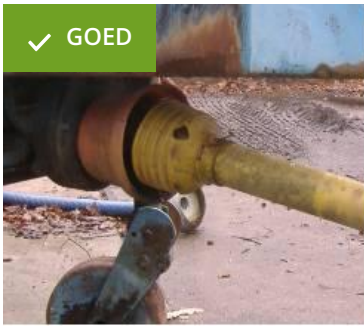
kap werktuigzijde aanwezig