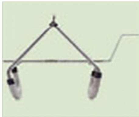
Foto: veeheupklem voor het verplaatsen van wrak of dood vee.

Op elk veebedrijf komen ziektes voor waardoor dieren niet meer zelf op hun poten kunnen staan of dood gaan. Het verplaatsen van een hulpeloos of dood dier is lichamelijk erg belastend. De inrichting van de stal en de aanwezige hulpmiddelen bepalen in belangrijke mate de zwaarte van de klus.