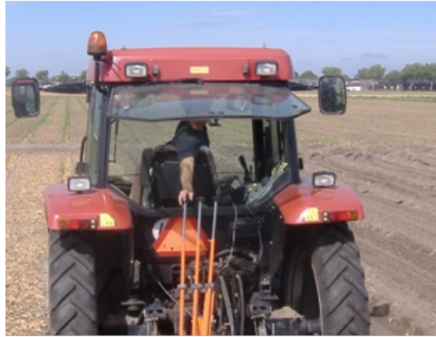
Foto: De bediening is te ver weg