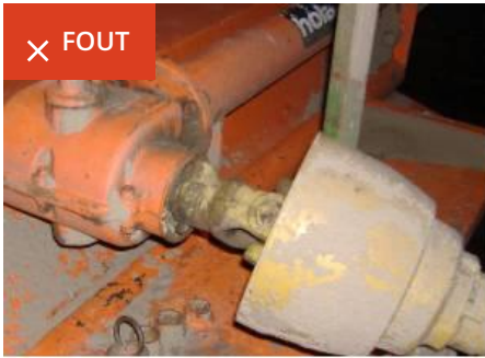
Kap werktuigzijde ontbreekt