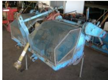
Foto: Oude beveiligde spitmachine