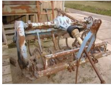
Foto: Oude onbeveiligde spitmachine