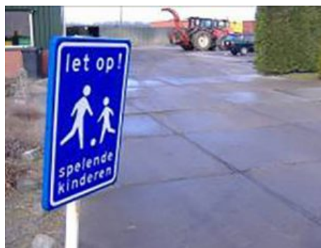
Foto: Voorbeeld waarschuwingsbord