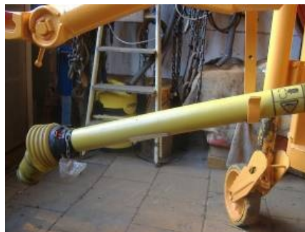
Foto: Houd de koppeling van de aftakas schoon