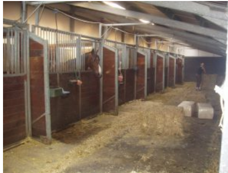
Foto: paarden op middenpad