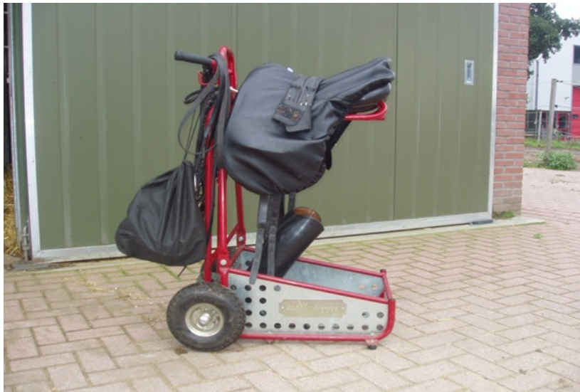
Foto: Zadelkamer, ponyzadels onderin