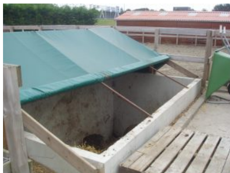
Foto: voorbeeld overdekte mestopslag