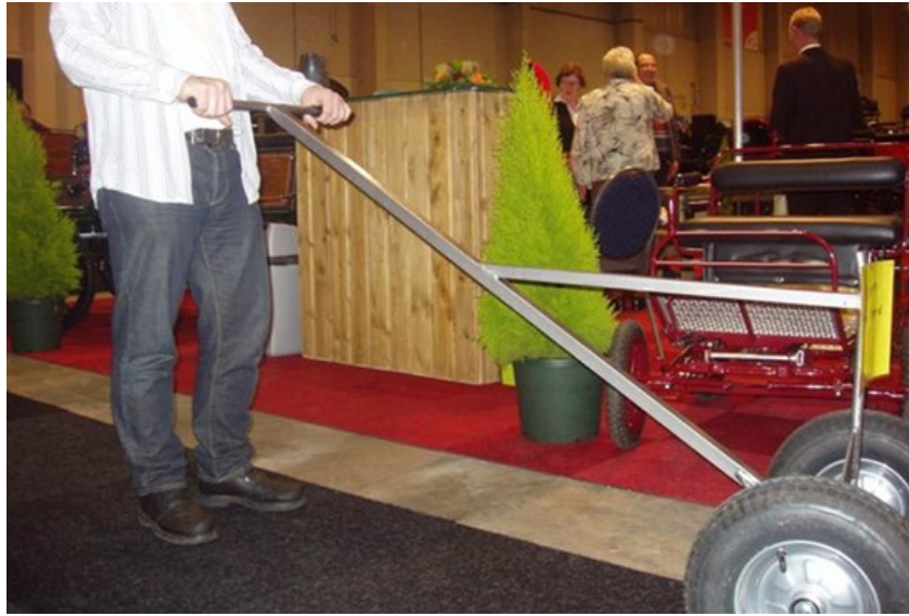
Foto: Verplaats met een rechte rug.