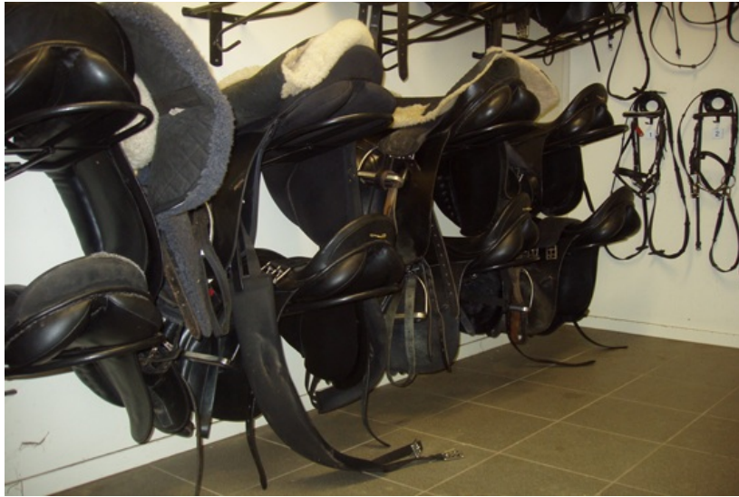
Foto: verrijdbare zadelkar