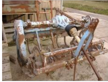
Foto: Oude onbeveiligde machine