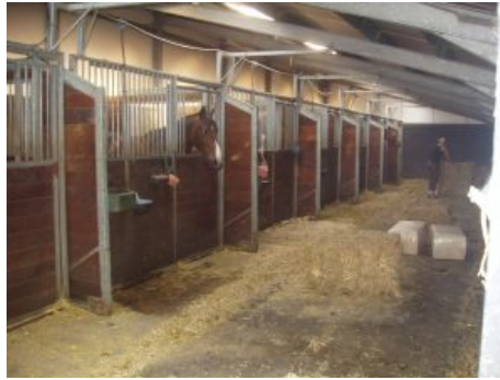
Foto: paarden op middenpad