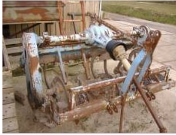
Foto: Oude onbeveiligde machine