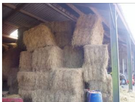
Voorbeeld onjuist gestapelde balen