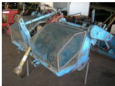
Foto: Oude beveiligde spitmachine