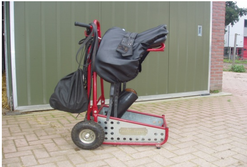
Foto: Zadelkamer, ponyzadels onderin