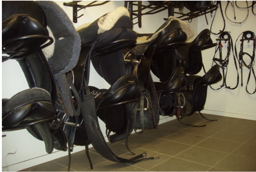
Foto: verrijdbare zadelkar