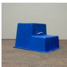
Foto: Opstapje voor gebruik in zadelkamer of als opstaphulp bij het opstijgen