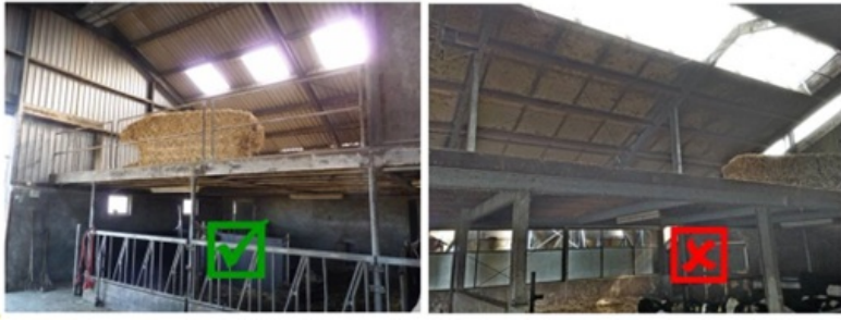
Foto Zolder met afscherming en open zolder