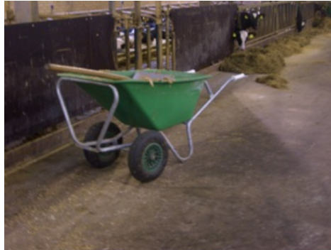
Kruiwagen met dubbel neuswiel