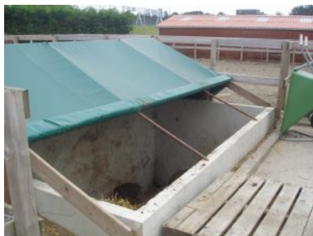
Foto: voorbeeld overdekte mestopslag