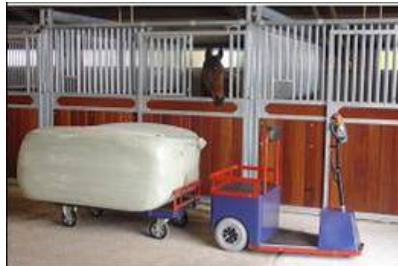
Foto: Bovenstaande elektrische wagen is ook een optie voor het verplaatsen van ruwvoer op een platte kar.