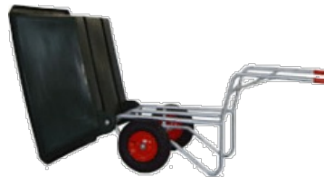
Kruiwagen met afkiepbare bak