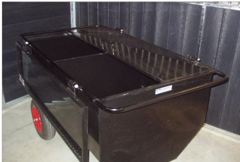
Foto: Voerkar bovenzijde