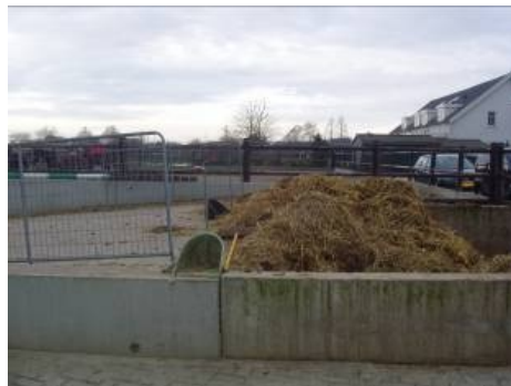
Voorbeeld mobiel hekwerk