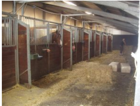
Foto: paarden op middenpad