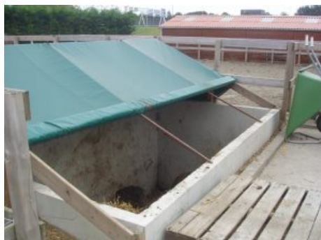
Foto: voorbeeld overdekte mestopslag