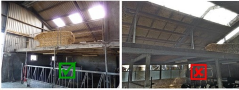
Foto Zolder met afscherming en open zolder