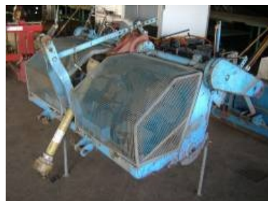
Foto: Oude beveiligde spitmachine