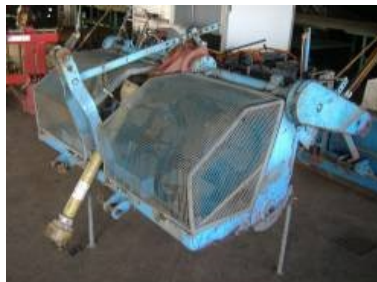
Foto: Oude beveiligde spitmachine