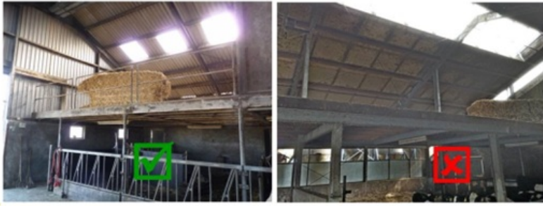
Foto Zolder met afscherming en open zolder