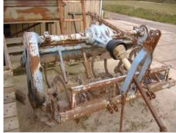
Foto: Oude onbeveiligde spitmachine