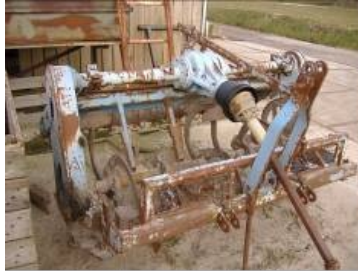
Foto: Oude onbeveiligde spitmachine