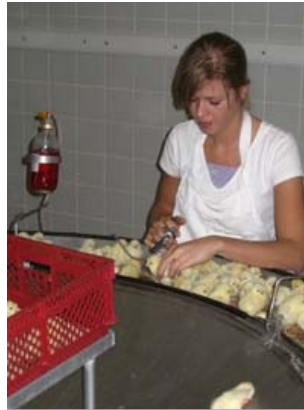
Handmatig enten van kuikens