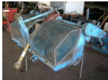
Foto: Oude beveiligde spitmachine