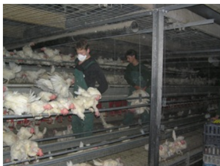
Vangen pluimvee vanaf opbouw staand