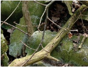
Asbesthoudend (zwerf)afval