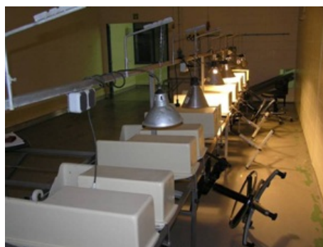
Werkplek voor seksen van kuikens