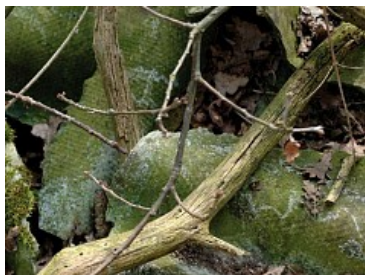
Asbesthoudend (zwerf)afval