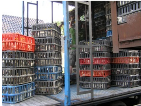
Stapelen van kratten met 2 personen