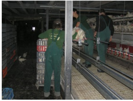
Overgeven aan krattenvuller