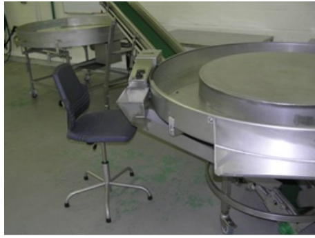
Enten van kuikens met semiautomaat