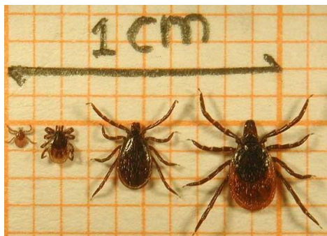
Van links naar rechts de larve, nimf, mannetje en het vrouwtje van de schapenteek

PMO bij Stigas met aandacht voor de ziekte van Lyme - Stigas biedt het volgende onderzoek aan bij werkenden in het groen: door middel van een vragenlijst die de deelnemer invult, en die is ontwikkeld in samenwerking met het Lyme expertisecentrum van Radboud UMC, kan bij de deelnemers gedacht worden aan een actieve ziekte van Lyme. Indien dat het geval is, dan worden deze mensen door de bedrijfsarts verwezen voor nader onderzoek naar het Lyme expertisecentrum. Daar vindt verder onderzoek plaats en indien nodig een behandeling gestart.