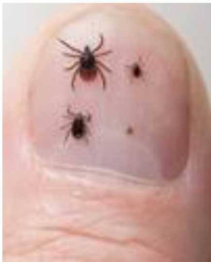
Teken op een duimnagel: van linksboven met de klok mee: volwassen vrouwtje, nimf, larve, volwassen mannetje. Foto's kunt u vinden bij het RIVM: voorlichtingsmateriaal tekenbeten en Lyme .

Een teek die zich net heeft vastgebeten is erg klein (niet groter dan 3 millimeter), donker gekleurd, plat, en is heel moeilijk dood te drukken. Pas na een paar dagen begint de teek op te zwellen.