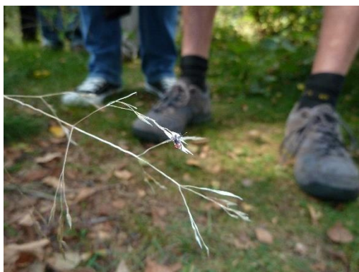
Teek op overhangende grasspriet, klaar een passerend been vast te grijpen

Misschien nog belangrijker is het vermogen tot risico-acceptatie en relativering. Het is goed te weten dat het gemiddelde groen geen 'tekenzee' is. Het aantal teken dat per 10 meter bospad klaar zit om zich vast te grijpen aan je broekspijp is vaak veel lager dan het aantal dat bijvoorbeeld met een wit laken gevangen wordt. In bossen vang je zo ongeveer 3 nimfen en volwassen teken per 10 m 2 , in de bebouwde kom ligt dat aantal ruwweg nog 10 keer lager. Dat zijn dan de teken die zich vastgrijpen aan een wit laken; het aantal dat zich aan de broekspijp vastgrijpt is nóg lager. Als je intensief met het groen in contact komt tijdens werk of recreatie, bijvoorbeeld door op het strooisel te knielen of te zitten, vergroot je natuurlijk de kans dat een teek overstapt. Hebben we het over de 'reuzenteek' die vorig jaar veel in het nieuws kwam is de trefkans nog véél lager: er werden er in heel Nederland maar een handvol gevonden. Natuurlijk is het wel belangrijk die ontwikkeling te volgen, maar het risico op een beet van deze teek ligt vooralsnog dichtbij nul.