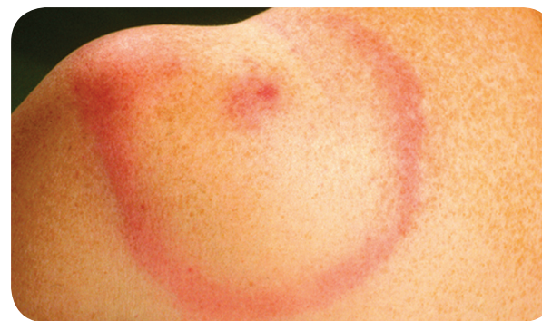
Rode ring op de huid

Als je de ziekte van Lyme hebt, dan krijg je vaak een rode ring om de plek waar je bent gebeten. Maar dit is niet altijd zo.