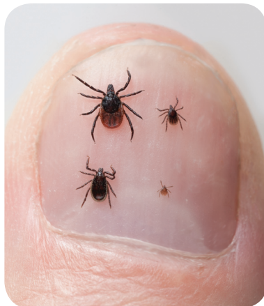
Teken op een duim

Teken zijn heel kleine beestjes. Ze lijken op spinnetjes.